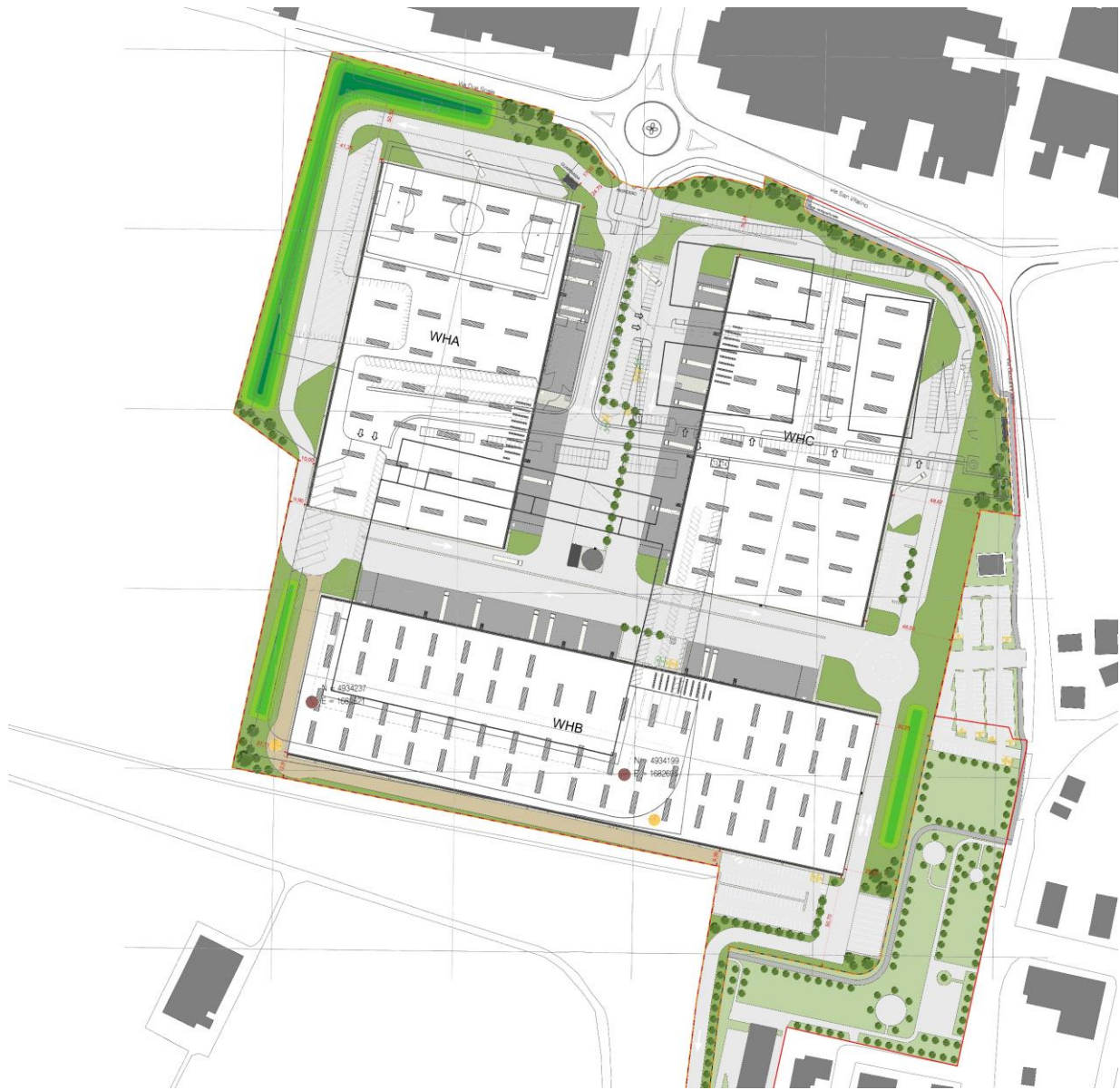
Sovrapposizione tra Progetto in oggetto e progetti precedentemente approvati sul sito