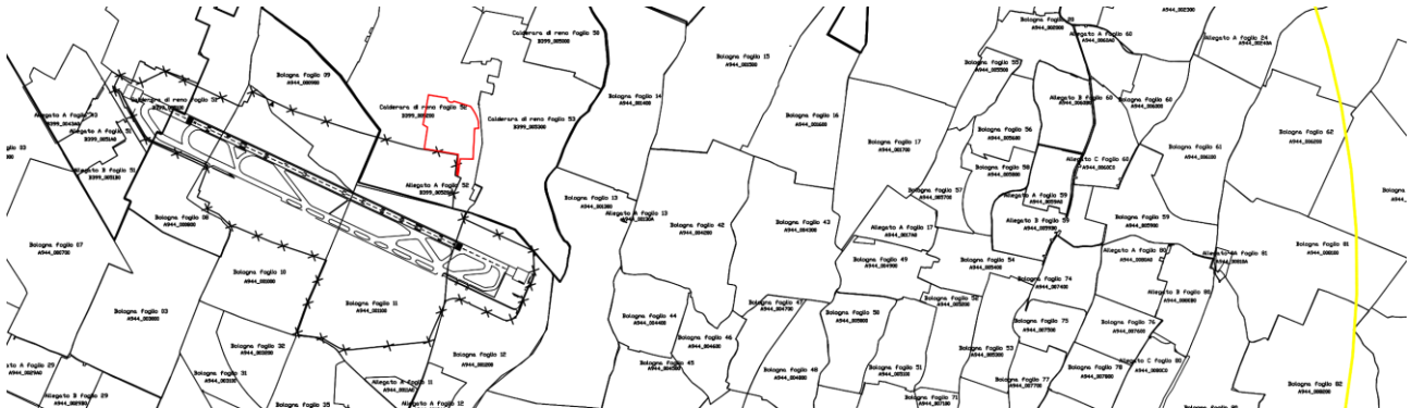
Estratto mappa dei vincoli